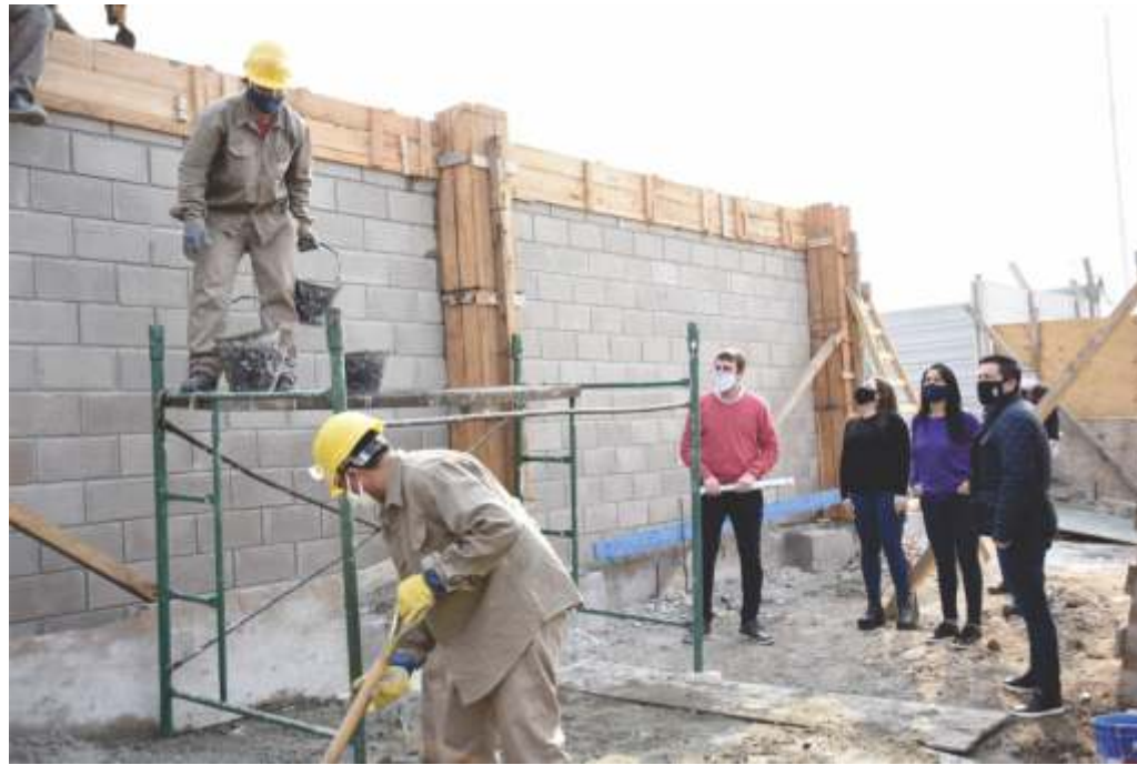
El polideportivo de Ing. Pablo Nogués ahora contará con una ampliación de 515 mts2, la cual consiste en la construcción de 2.600 mts2.

El jefe comunal afirmó: "El polideportivo fue inaugurado el año pasado para que grandes y chicos puedan concurrir a diferentes y múltiples actividades, incluyendo la colonia de verano. Ahora estamos en el inicio de la construcción de la cobertura de la pileta, para poder hacerla climatizada como en el polideportivo de Los Polvorines, y una vez pasada esta pandemia, se pueda utilizar durante todo el año".